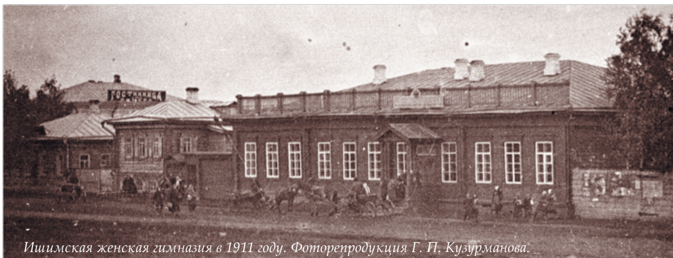
Ишимская женская гимназия в 1911 году.