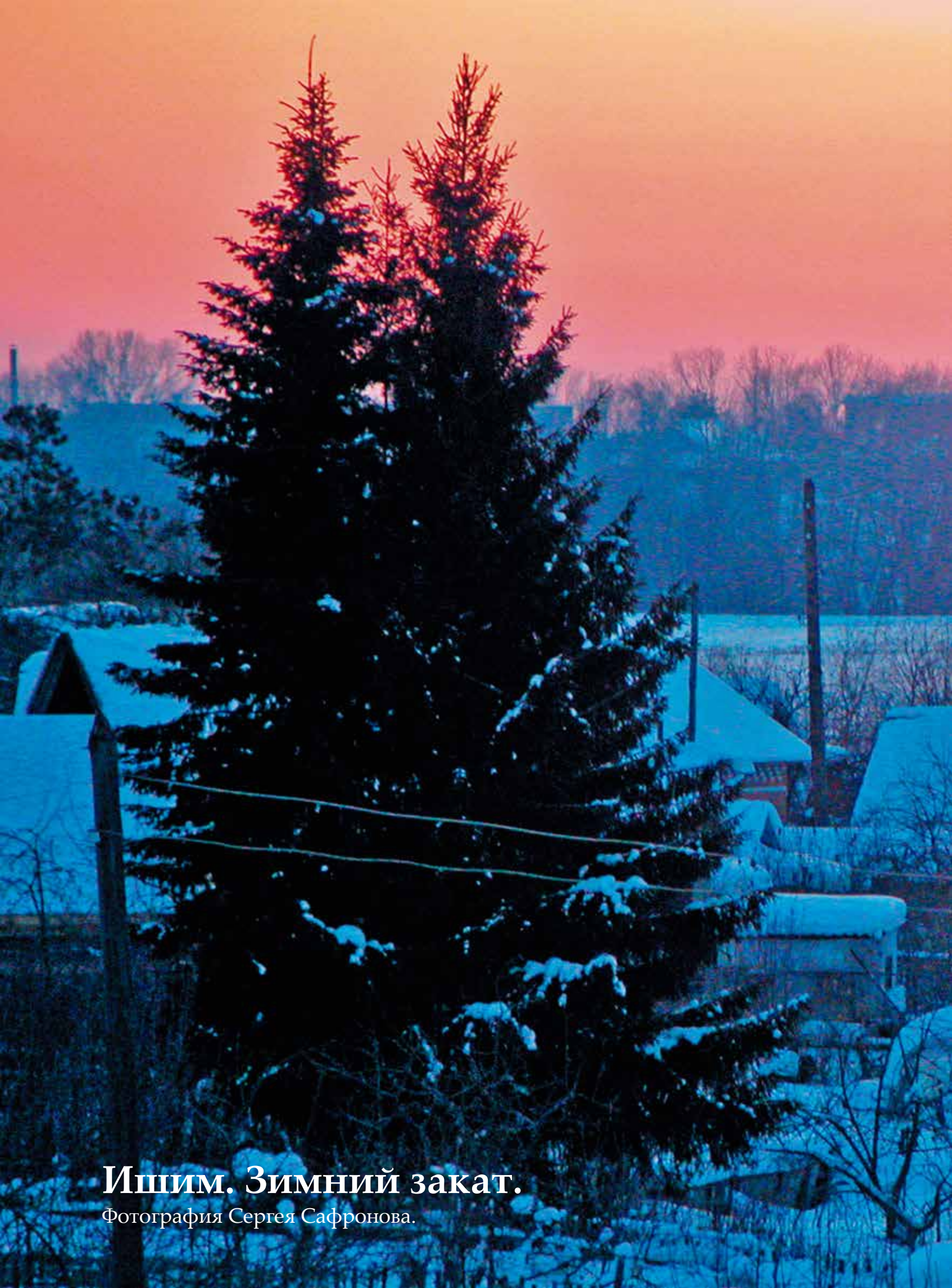
Ишим. Зимний закат.